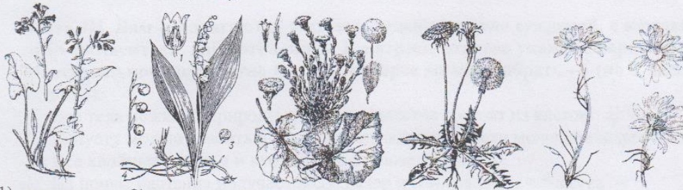
1) медунца; 2) ландыш; 3) мать-и-мачеха; 4) одуванчик; 5) ромашка.

1. Перечислите растения в том порядке, в котором они начинают цвести в природе (от более ранних к самым поздним).